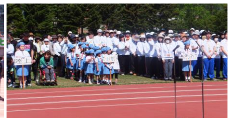
ボランティア of 皆さん