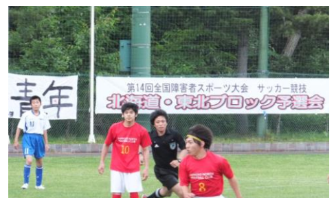
白旗山競技場 サッカー競技