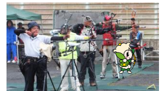
アーチェリー競技