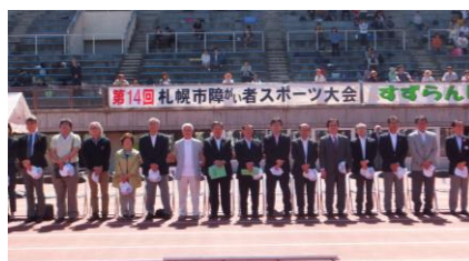
競技役員 of 皆さん