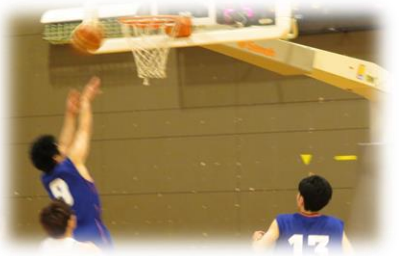
バスケットボール競技