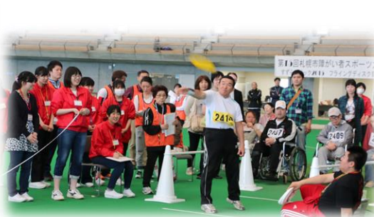
フライングディスク競技