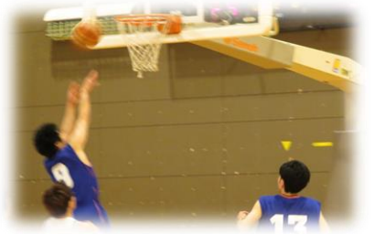
バスケットボール競技