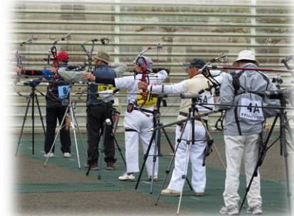
アーチェリー競技