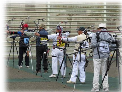
アーチェリー競技