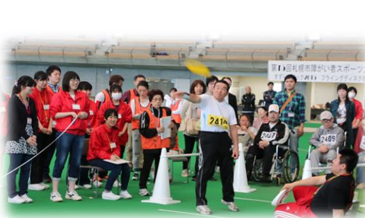
フライングディスク競技